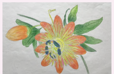
色鮮やかに細かい所まで塗られ、凛とした花の塗り絵を完成されました。