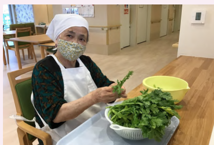
春菊と湯葉のお浸しを美味しく作って下さいました。