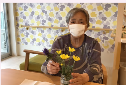
屋上で積んだ花を素敵に飾って下さいました。