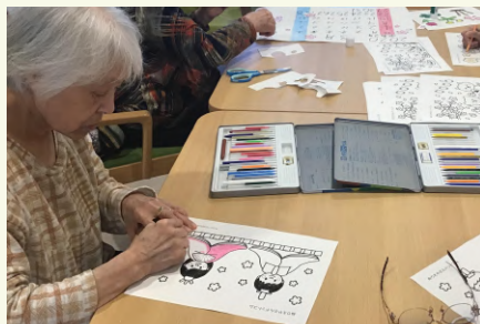
塗り絵のレクリエーションがお好きで、いつも丁寧かつ綺麗に作品を作られています^^