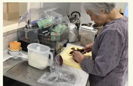
お米を研いだり調理をしたり、家事ならなんでもお得意です!!