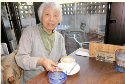
群馬県出身で東京ではご主人と家具屋さんを営んでいました。とっても優しくて世話好きな方です♪