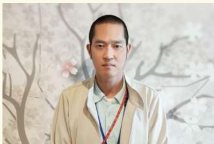
*ユニット担当(主任CM) 宜しくお願いいたします。