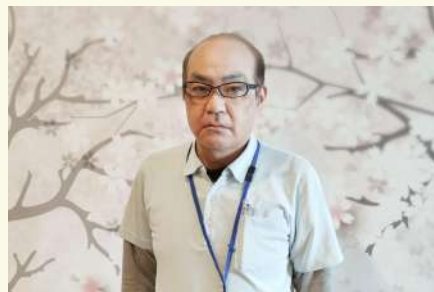
*従来担当 今後とも宜しくお願いいたします!!