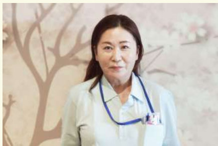
*ユニット担当 新人です。宜しくお願いします!!