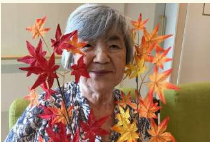
いつでもニコニコされ、笑顔 が絶えません。