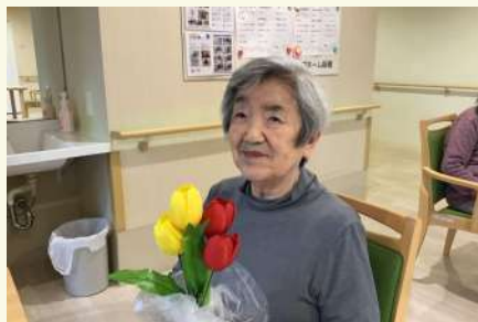
とっても謙虚な方で おっとりとしていて大らか。