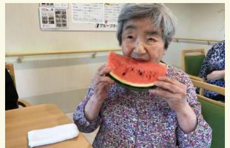
時にはユーモアを発揮し、 笑わせる事も。