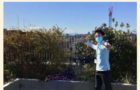
屋上からは富士山が見えます。 地域に愛される施設を目指して いきます！