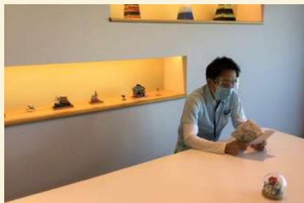
趣味は茶道・読書・音楽鑑賞 ・絵を描くこと・庭いじり・ 蟻螂観察・スポーツ観戦