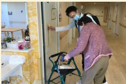
ケアホーム板橋チーム一丸となり、ご入居者様の笑顔を引き出していきます！