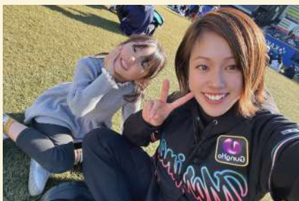
今年小学校に上がる小学生のお母さん。女子には敵わない