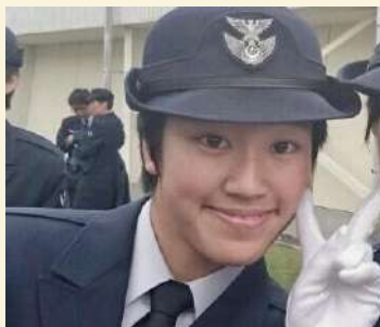
父の夢を叶えるべく、航空自衛隊に入隊しました🛩️