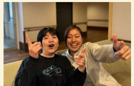
利用者さんの立場に立っていつも明るく笑顔がモットーです♪