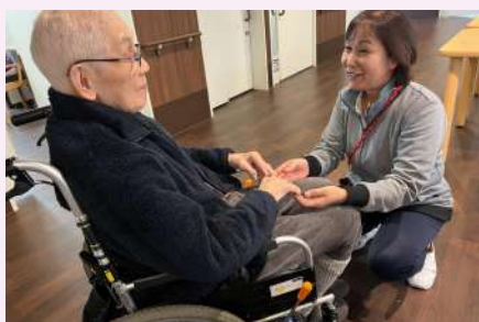
利用者様との寄り添いを大切にしています