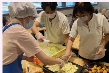
たこ焼き職人です！！