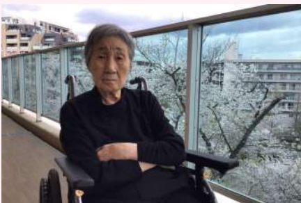
満開の桜を見て「綺麗ね！」と笑顔。