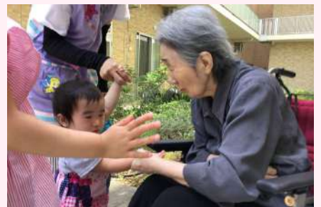
小さい子供と握手され笑顔に。