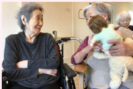
昔からお二人仲が良く、笑顔も多く楽しく過ごされます。