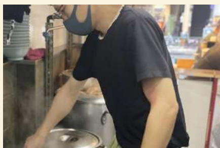
元・職人さん！！ 一体、何の職人さんでしょう か…🍜