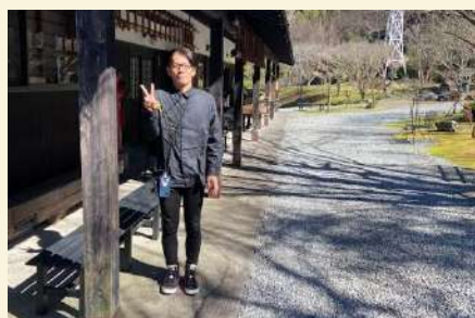
趣味は寺社巡り👣 色々な場所へ足を運んだそうです♪