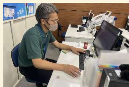
事務のお仕事は、特に集中力が 大切！！いつも頼りにしていま す🌟