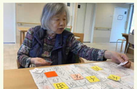
漢字パズルで楽しく脳トレをしています。