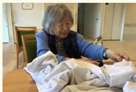
洗濯物も丁寧に畳んで下さいます。