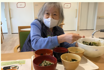
おかずを綺麗に盛り付けて下さいます。