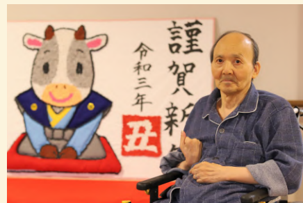
国立劇場の本を見て絵を描くことが今の目標で勉強中です☆