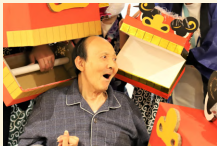
お寿司が好きで会社帰りに友人や会社の方と毎日のように一緒に行かれていたそうです♪