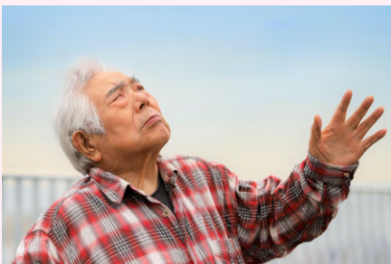
好きな食べ物 マグロの刺し身🐟