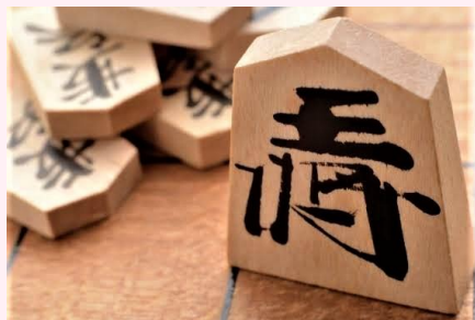
好きなことは 将棋で勝利する事 時代劇鑑賞📺