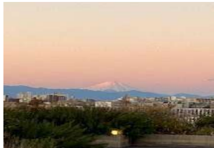
元旦の屋上から見た富士山です

初日の出に照らされた富士山も望め、今年も無事に新年を迎えることが出来ました。今年も皆さんに楽しんでいただけるようなイベントをたくさん考えていきますので宜しくお願い致します！