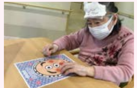
レクリエーションや行事を楽しみながら参加されています。