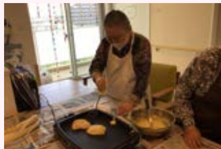
お料理作りなど丁寧に行ってください。