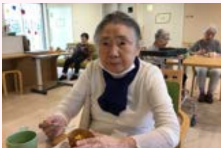
笑顔がとても素敵なお方です。