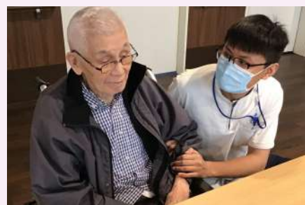
皆様の笑顔の為に全力で頑張ります。