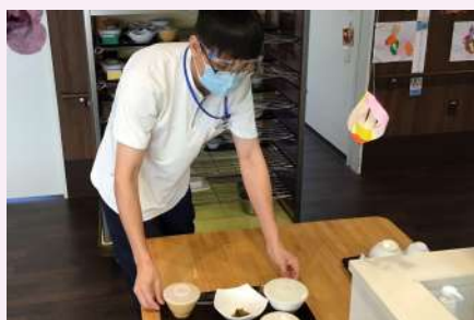
ジムに通い筋トレをしています。